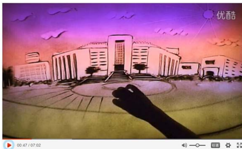
图2 电子科技大学图书馆“沙画”视频图片

“‘八角书斋’等你一起触摸大师经典, 品读百样人生!” 8月31日, 电子科大图书馆在迎新季首次推出具有“水韵墨香”的图书馆“沙画”视频, 以吸引莘莘学子入馆学习。