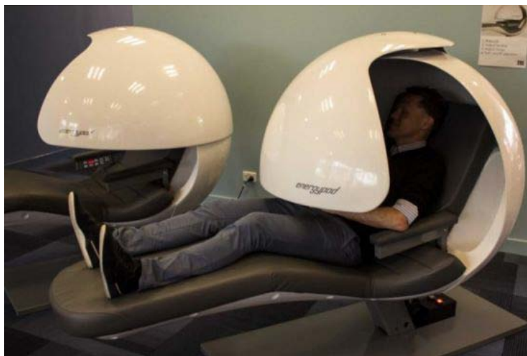
图1:埃迪斯科文大学图书馆安装两台高科技“能量睡眠舱”(energypods)

位于西澳州首府城市珀斯的埃迪斯科文大学一改大学图书馆不许说话的惯例,不仅允许学生交谈、吃东西,还为他们打盹提供了便利。